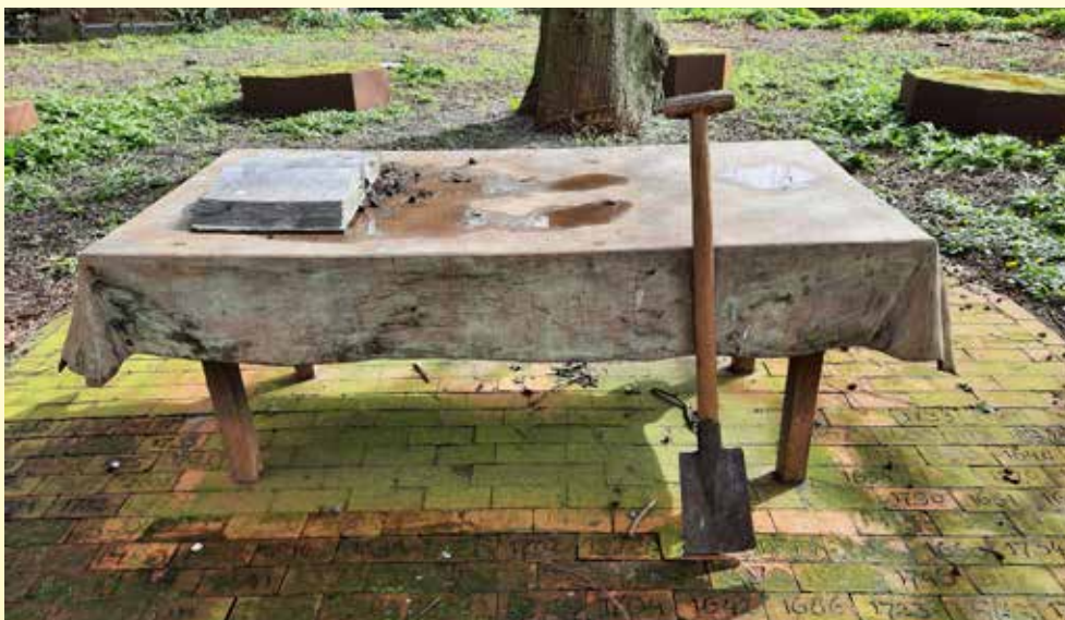
Net als in de tijd van Walfridus moeten we aan de slag.

In hoofdstuk 2 lichten we de totstandkoming van de dorpsvisie toe. Welk proces is doorlopen en welke middelen zijn er ingezet? Maar bovenal: wat is de respons geweest vanuit het dorp? De speerpunten van de dorpsvisie staan in hoofdstuk 3. Vanaf hoofdstuk 4 komen alle thema's aan bod: van de huidige situatie met wensen naar de actiepunten die daarbij horen.