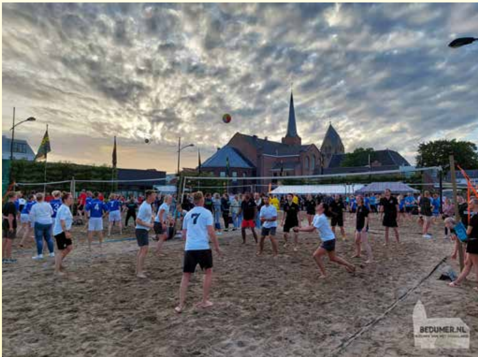
Bedum, april 2024 Dorpsvereniging Algemeen Plaatselijk Belang Bedum